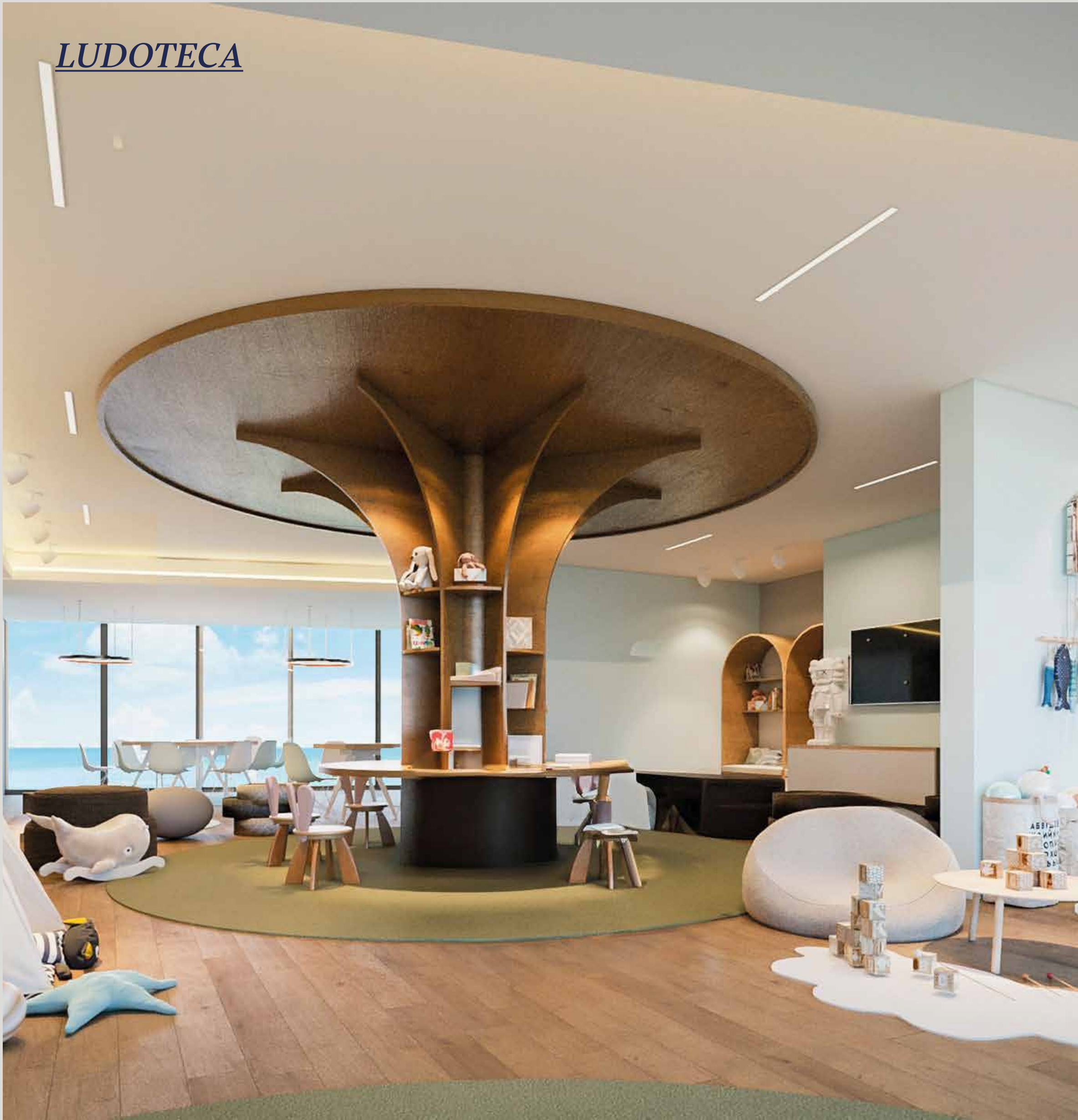
COZUMEL | QUINTANA ROO