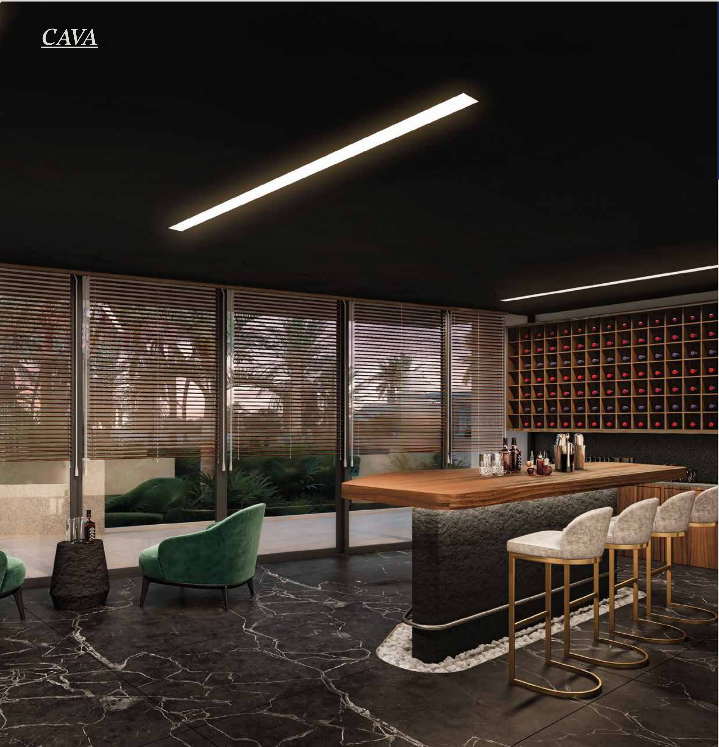
ANTILIA - BEACHFRONT RESIDENCES