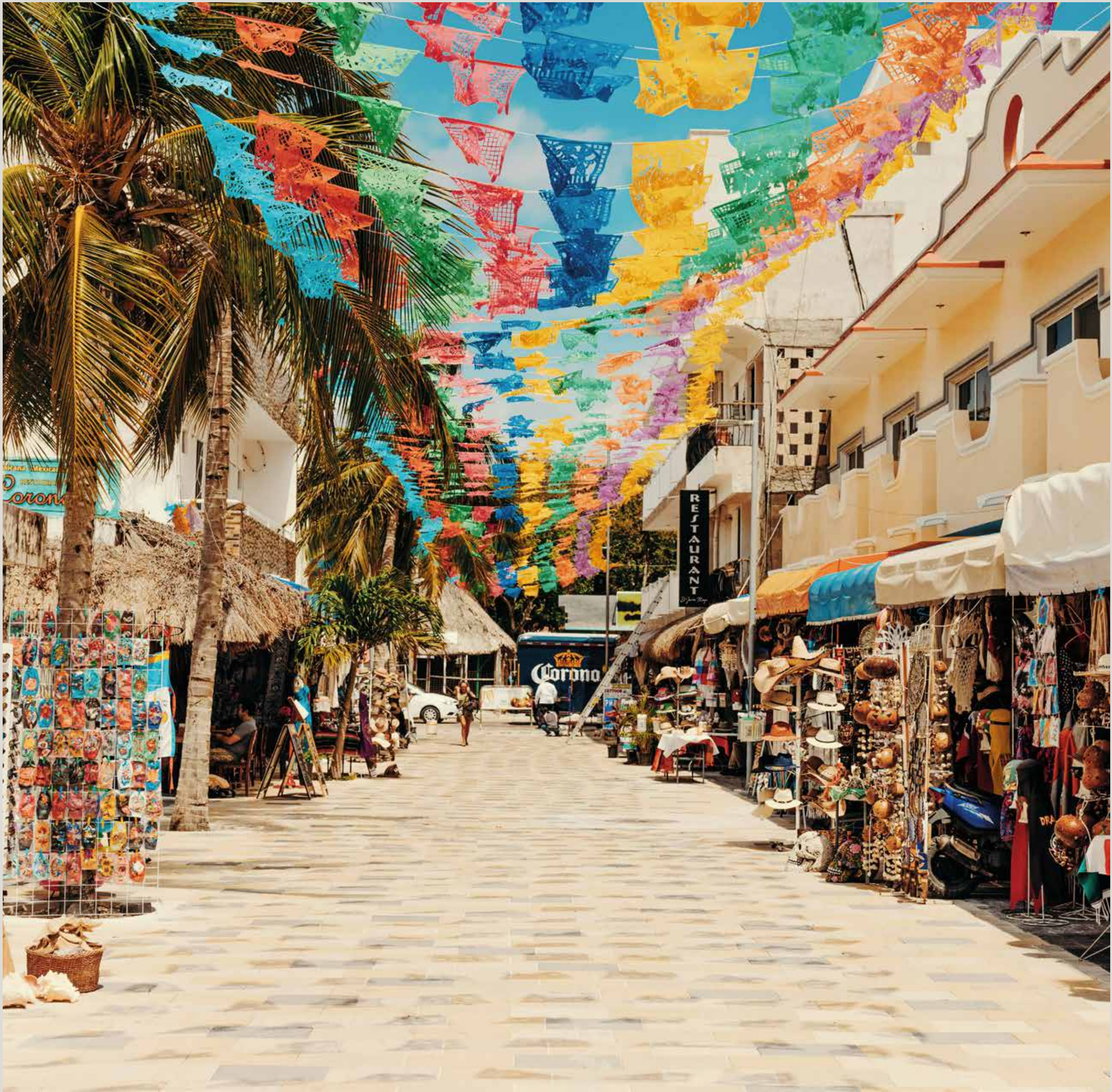
COZUMEL | QUINTANA ROO