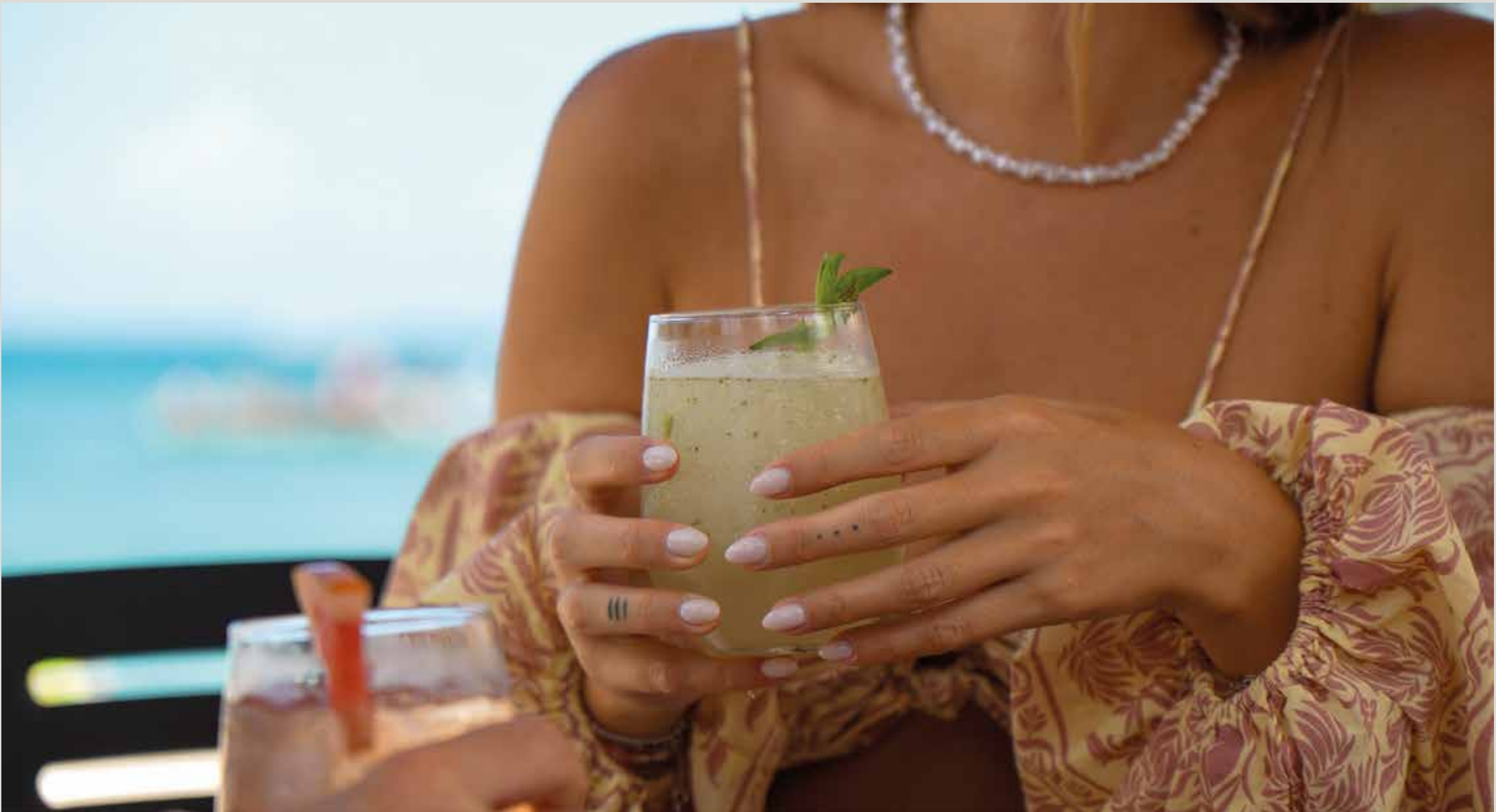
ANTILIA - BEACHFRONT RESIDENCES